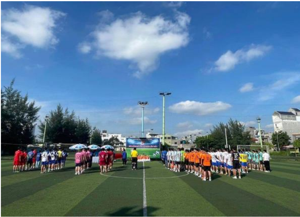
Khai mạc giải bóng đá cán bộ đoàn tỉnh Thái Bình năm 2023 Ký kết thoả thuận hợp tác giữa Đoàn thanh niên tỉnh và VNPT Thái Bình giai đoạn 2023-2027