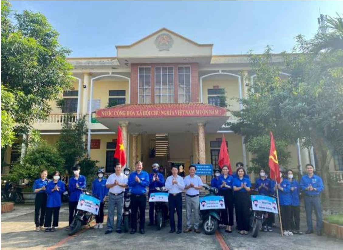
Ban Thường vụ Tỉnh đoàn - Hội đồng Đội tỉnh chỉ đạo cấp bộ Đoàn - Đội trên địa bàn toàn tỉnh đồng loạt ra quân tổ chức Ngày cao điểm chiến sỹ tình nguyện “Vì đàn em thân yêu” năm 2023