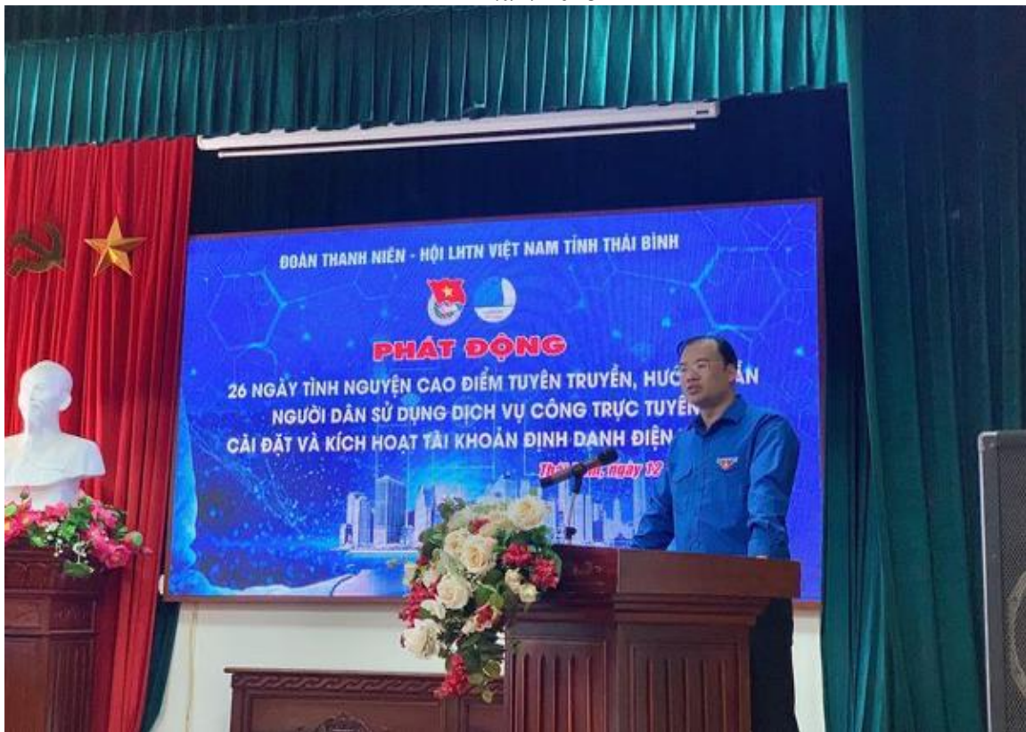
Ban Thường vụ Tỉnh đoàn - Ban Thư ký Hội Liên hiệp Thanh niên Việt Nam tỉnh tổ chức Chương trình Phát động 26 Ngày tình nguyện cao điểm tuyên truyền, hướng dẫn người dân sử dụng dịch vụ công trực tuyến, cài đặt và kích hoạt tài khoản định danh điện tử VneID năm 2023.