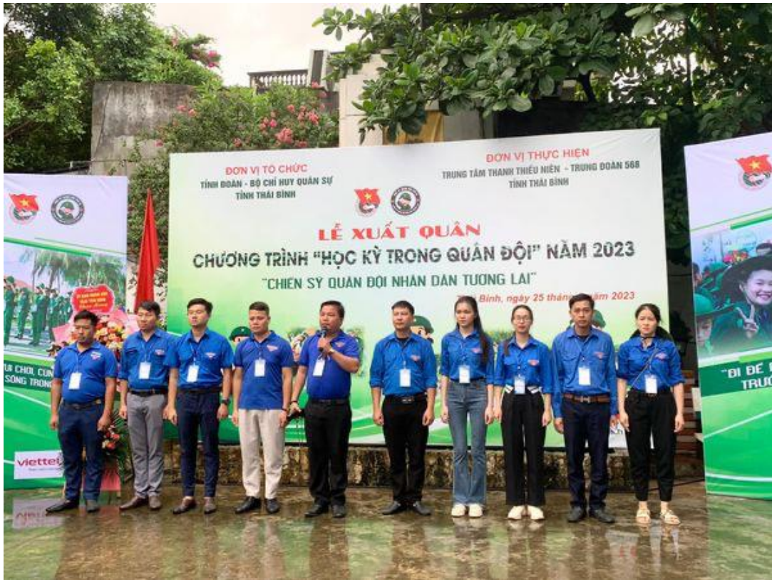
Tỉnh đoàn Thái Bình, Bộ Chỉ huy Quân sự tỉnh phối hợp tổ chức Lễ xuất chương trình “Học kỳ trong quân đội” năm 2023